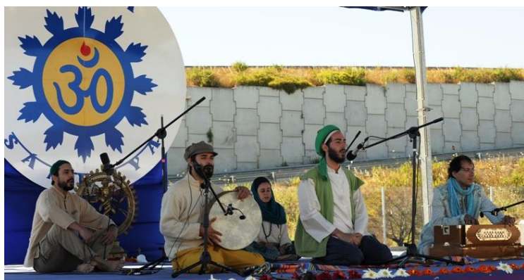
DHIKR - Meditation Soufi par Abdul Latīf, de l’Ordre Soufi Naqshbandi