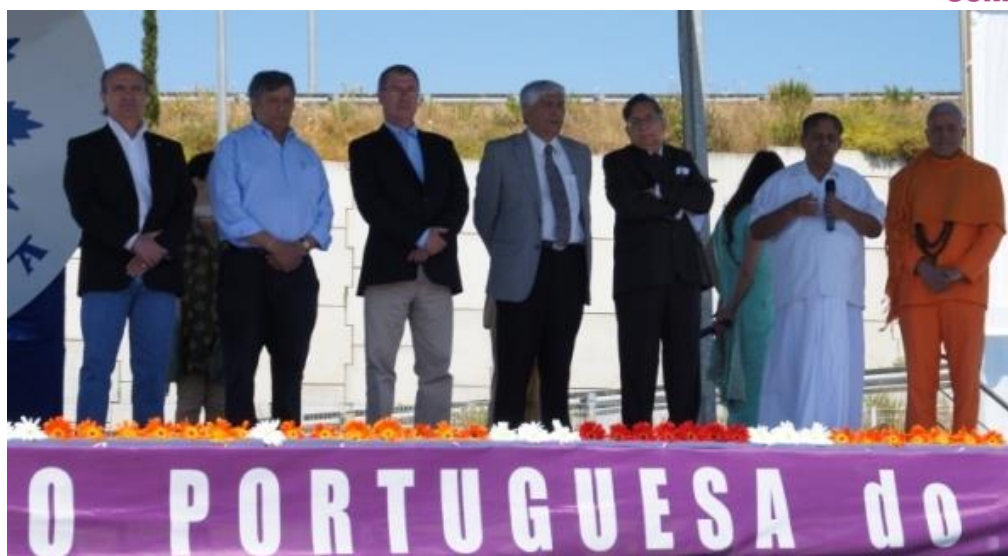
Les Entités Officielles