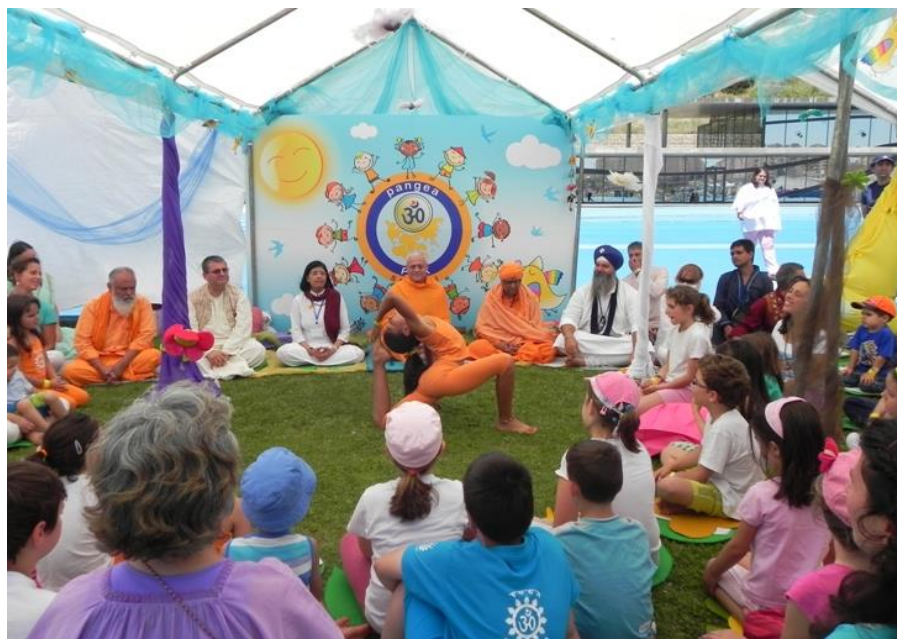
Yoga pour Enfants – pour la Défense du Futur – de l’auto responsabilité et de la préservation des Écosystèmes et de la Fraternité