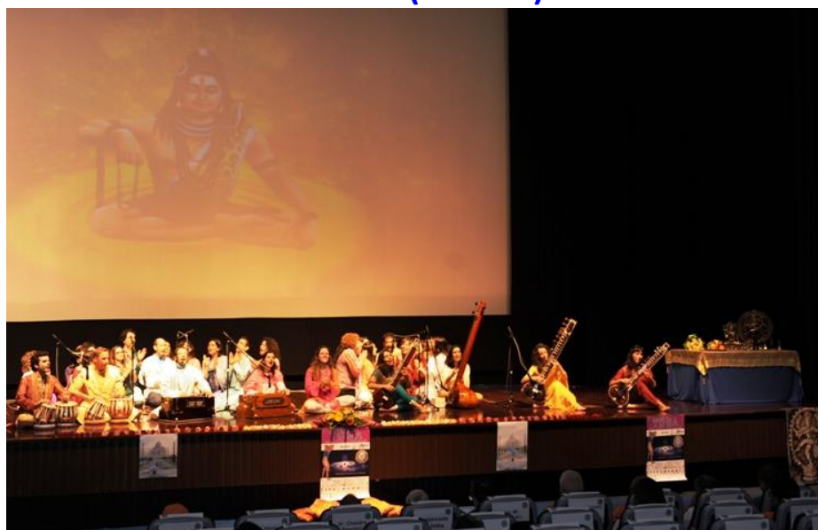
Omkāra lors de l'ouverture de la Journée du Darshana