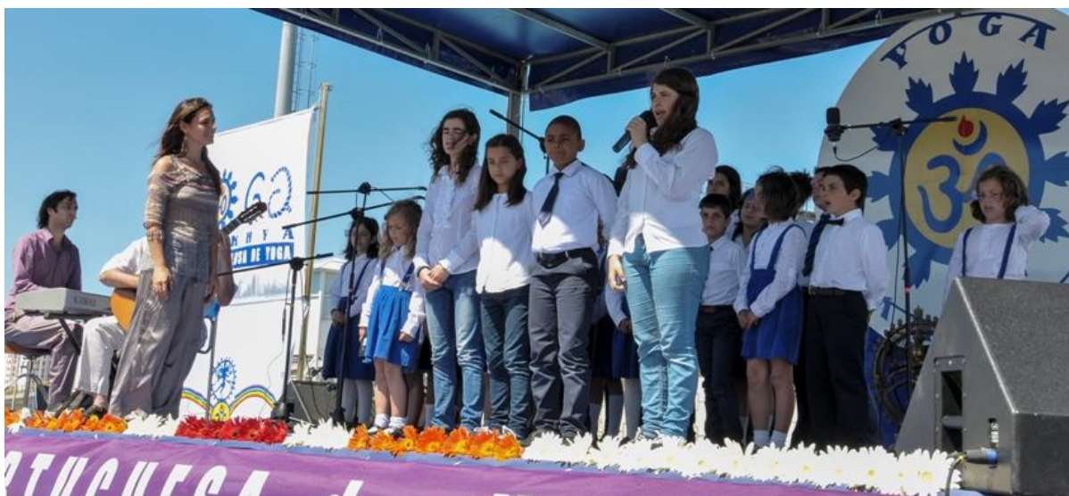
Chœur d’Enfants de Santo Amaro de Oeiras

L’Ouverture de l’International Day of Yoga - IDY / Journée Internationale du Yoga pour Enfants a été faite sur scène par le Chœur d’Enfants de Santo Amaro de Oeiras, avec le thème O MEU PLANETA AZUL qui en mai 2012 a gagné le Concours international de la Global Rockstar, parmi 350 musiques du Monde entier, ce qui les a conduit à participer au Sommet de la Terre à Rio de Janeiro. Après la prestation du Chœur d’Enfant a eu lieu un Cours de Yoga spécialement dédié aux 150 enfants qui étaient présents.