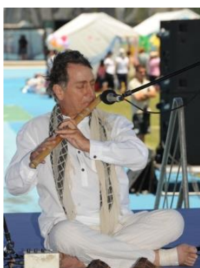
Le fabuleux Art de Rão Kyao et sa musique

LA VILLE DE LISBONNE a été l’hôte de cette Grande Célébration, se constituant comme un partenaire structurant de ce Projet Global, contribuant avec l’AMBASADE D’INDE, LE PLAN POUR L’ÉTHIQUE DANS LE SPORT, la FONDATION INATEL et le COMITÉ OLYMPIQUE DU PORTUGAL à sa valorisation et diffusion. Le Haut Commissariat à l’Immigration et au Dialogue Interculturel, l’UNICEF, la Fondation Pró-Dignitate, Fondation de la Jeunesse, Institut Portugais de la Jeunesse et toute la Communauté Hindoue du Portugal ont soutenu cette initiative.