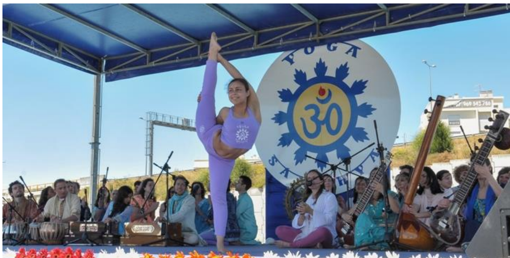
PASHUPATI et OMKĀRA en scène

Cette Journée a déjà été officiellement proclamée en Inde en 2011 – Décembre 4 et 5 – lors d’un Sommet ayant réuni les Principaux Lignages du Yoga Traditionnel de l’Inde, co-organisé par la Confédération portugaise du Yoga (seule institution non Indienne acceptée à ce Sommet). Depuis, le nombre de pays et d’Institutions du Yoga qui s’étant joints à ce mouvement a exponentiellement augmenté, l’International Day of Yoga - IDY / Journée Internationale du Yoga ayant cette année été célébrée dans plus de 30 Villes de par le Monde.