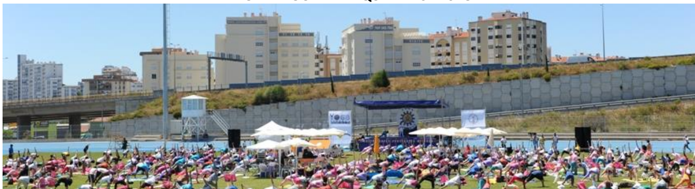
Plus de 1000 pratiquants lors de la Journée Internationale du Yoga – Méga Cours de Yoga – Mahā Shakti Namaskāra

Avec le soutien de la VILLE DE LISBONNE, FONDATION INATEL, COMITÉ OLYMPIQUE DU PORTUGAL et PLAN NATIONAL POUR L'ÉTHIQUE DANS LE SPORT