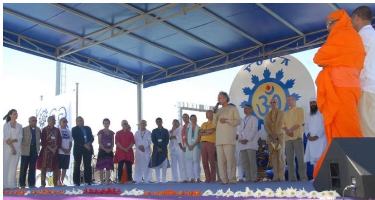
Toutes les Écoles de Yoga sur Scène – Inde, Amériques, Europe - Portugal inclus