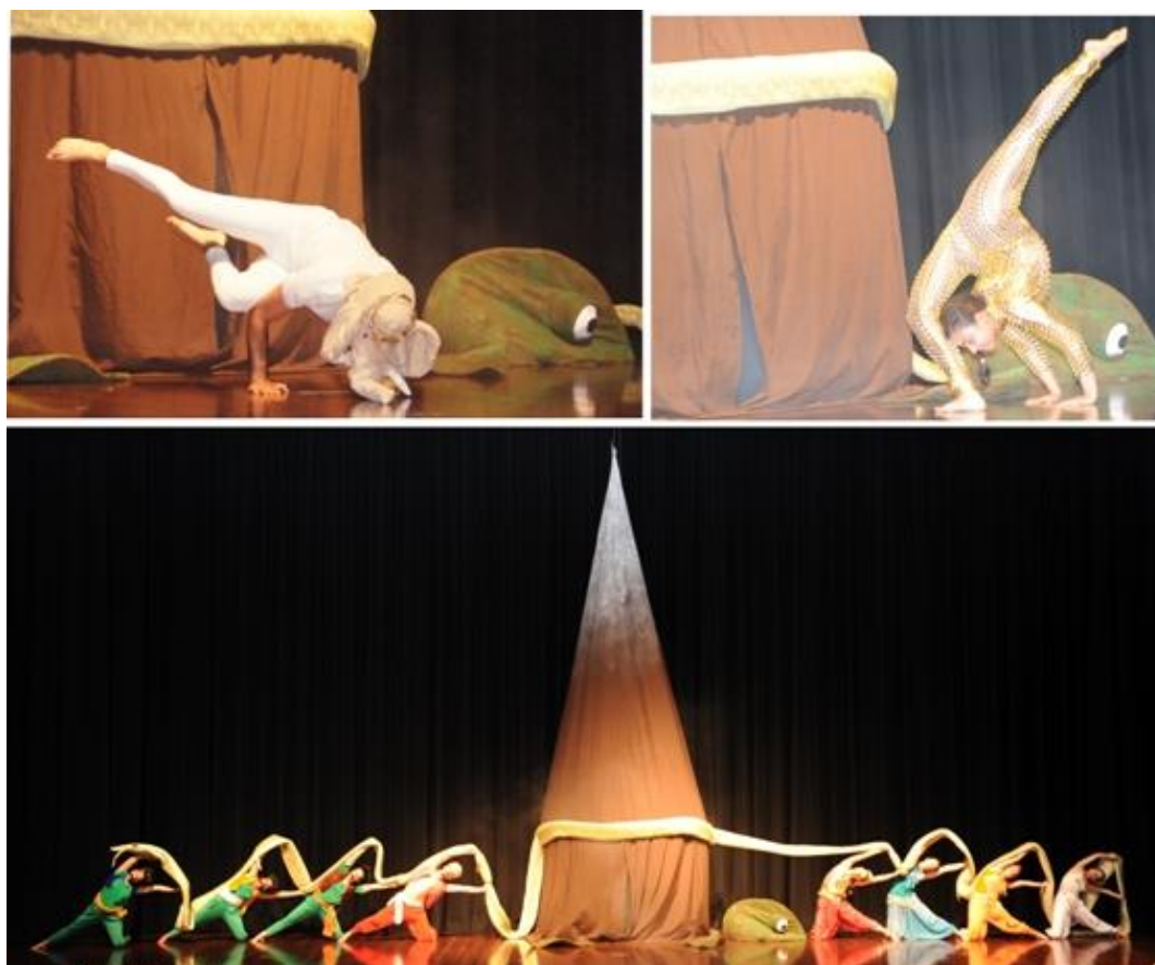
La Magie de la Présentation du PASHUPATI