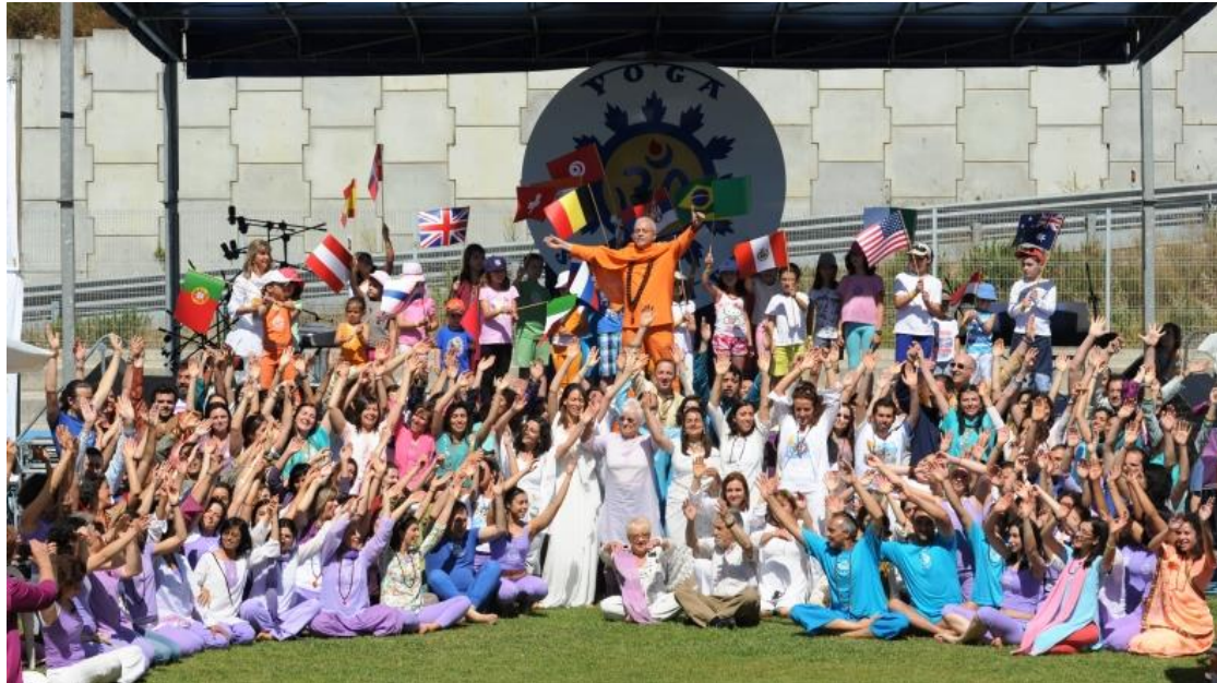
L'Ouverture de l'International Day of Yoga - IDY / Journée Internationale du Yoga, les Professeurs de la Confédération Portugaise du Yoga, du Portugal, les Enfants, le Monde, et l'Avenir

L'International Day of Yoga - IDY / Journée Internationale du Yoga est Candidate Précurseure auprès des Nations Unies / UNESCO à PREMIÈRE JOURNÉE GLOBALE . Elle a lieu en un Auspice Cosmique - Supra Culturel - un Solstice - Juin, 21 (célébrée le dimanche suivant quand cela ne coïncide pas).