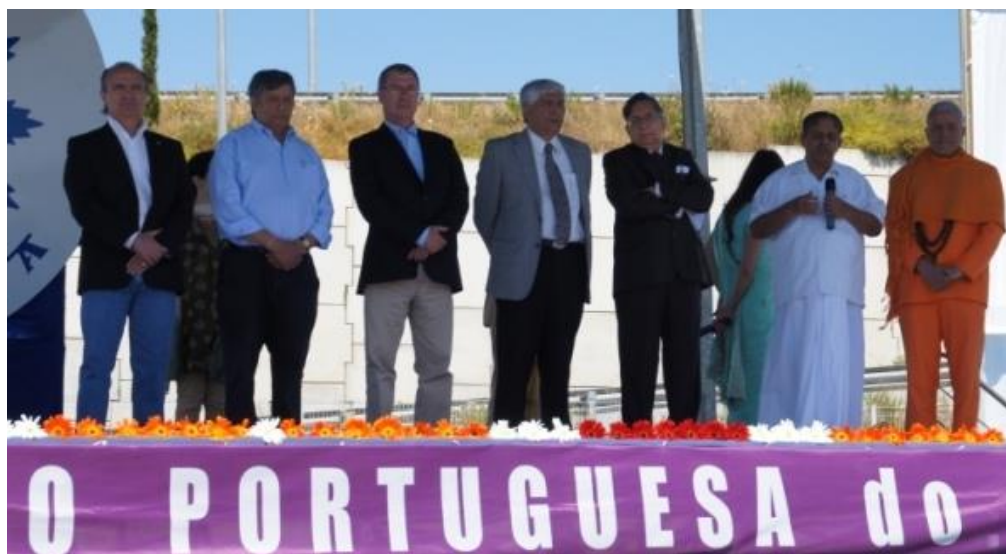
As Entidades Oficiais