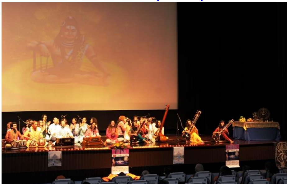
O Omkára na abertura do Dia do Darshana