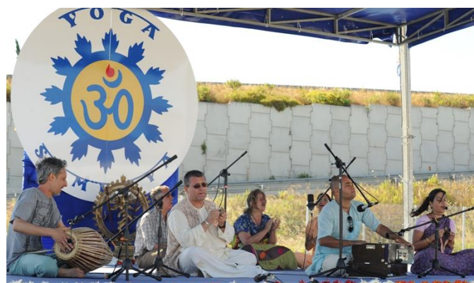
A intervenção da Escola do Yoga convidada – ISKCON - Movimento Hare Krishna Internacional