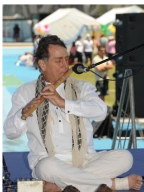
A fabulosa arte do Rao Kyao e a sua música

A CÂMARA MUNICIPAL DE LISBOA foi a anfitriã desta Grande Comemoração, constituindo-se como um parceiro estruturante deste Projecto Global, contribuindo conjuntamente com a EMBAIXADA DA ÍNDIA, PLANO NACIONAL PARA A ÉTICA NO DESPORTO, a FUNDAÇÃO INATEL e o COMITÉ OLÍMPICO DE PORTUGAL para a sua valorização e divulgação. Também o Alto Comissariado para a Imigração e Diálogo Intercultural, UNICEF, Fundação Pró-Dignidade, Fundação da Juventude, Instituto Português da Juventude, e toda a Comunidade Hindu de Portugal apoiaram esta iniciativa.