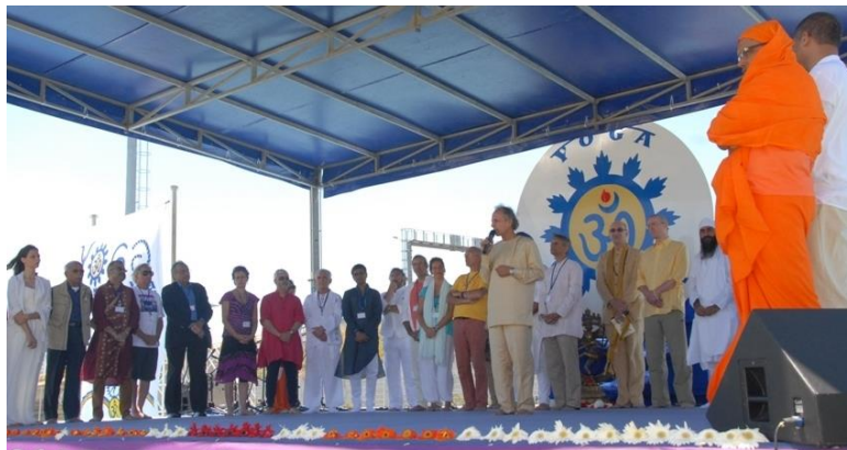
Todas as Escolas do Yoga em Palco – Índia, Américas, Europa com Portugal incluído