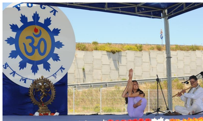
A simbiose da Flauta de Rao Kyao e o Yoga Avançado do Pashupati, no Yoga e Arte