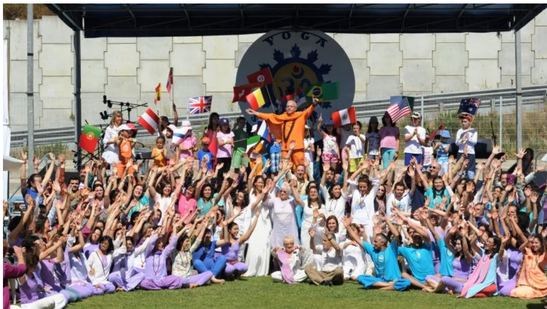
A Abertura do International Day of Yoga - IDY / Dia Interacional do Yoga Professores da Confederação Portuguesa do Yoga, e de Portugal, as crianças, o Mundo, e o Futuro

O International Day of Yoga - IDY / Dia Internacional do Yoga é um Candidato precursor junto às Nações Unidas / UNESCO a PRIMEIRO DIA GLOBAL , celebra-se num Auspício Cósmico – Supra Cultural – um Solstício – Junho, 21 – ( comemorado sempre no Domingo seguinte quando não coincidente).