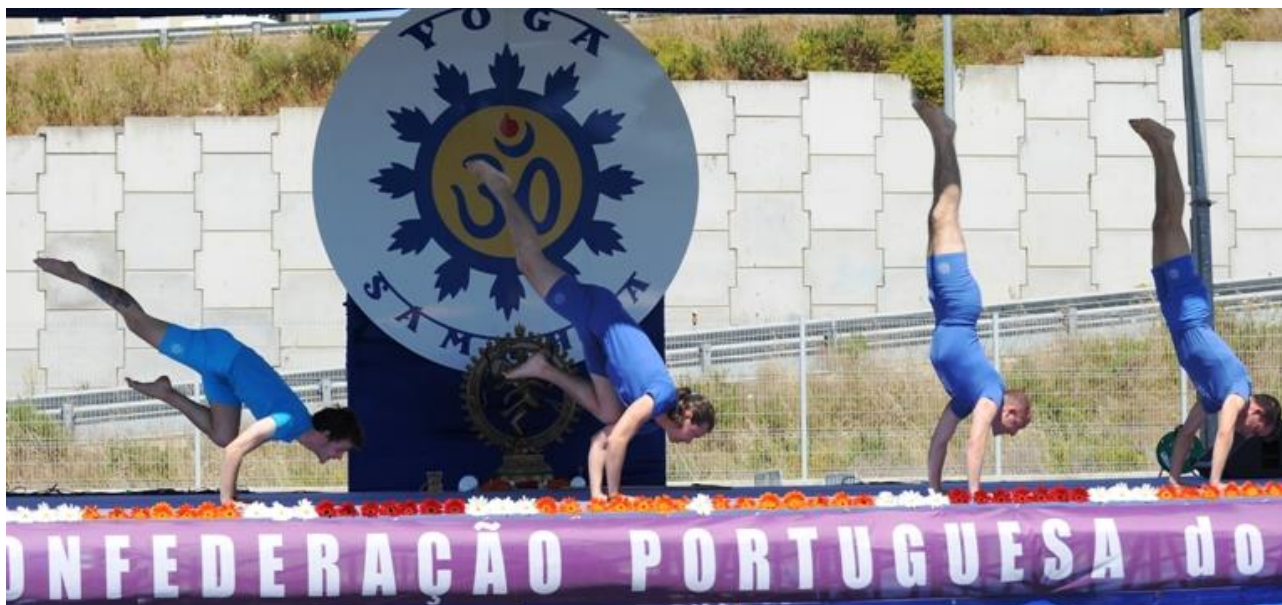
O Yoga Avançado do PASHUPATI