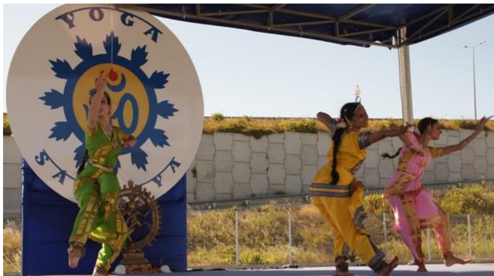
Apresentação de Bhárata Nathá Yama pelo Grupo Shiva Rája

As Comemorações enfatizaram também o trabalho dedicado da Sorriso Solidário - Associação de Apoio a Causas Sociais, Ambientais e Culturais, AGROBIO - Associação Portuguesa de Agricultura Biológica, e LPN – Liga de Protecção à Natureza.