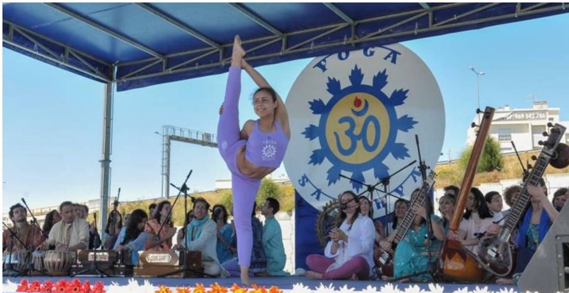
PASHUPATI e OMKÁRA em palco

Este Dia já foi oficialmente proclamado na Índia em 2011 – Dezembro 4 e 5 – numa Cimeira que juntou as Principais Linhagens do Yoga Tradicional da Índia, com a Co-Organização da Confederação Portuguesa do Yoga (única Instituição de fora da Índia aceite nesta Cimeira). Desde então o número de Países e Instituições do Yoga que se juntaram a este movimento cresceu exponencialmente, tendo neste ano de 2013, o Dia Internacional do Yoga sido comemorado em mais de 30 Cidades por todo o Mundo.