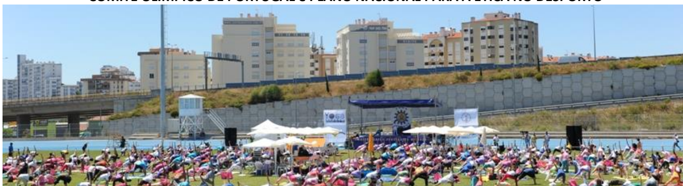
Mais de 1000 praticantes Dia Internacional do Yoga – Mega Aula do Yoga – Mahá Shakti Namaskára

Organização da CONFEDERAÇÃO PORTUGUESA do YOGA com o apoio da CÂMARA MUNICIPAL DE LISBOA, FUNDAÇÃO INATEL, COMITÉ OLÍMPICO DE PORTUGAL e PLANO NACIONAL PARA A ÉTICA NO DESPORTO