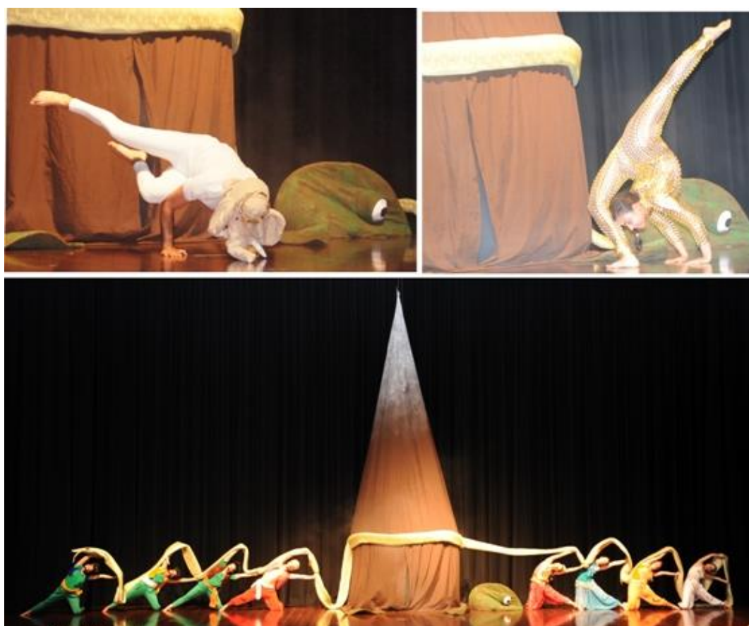
A Magia da Apresentação do PASHUPATI