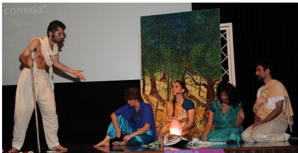
MÁYÁ – Grupo de Teatro Amador da Confederação Portuguesa do Yoga

Este Dia contou também com uma apresentação do MÁYÁ – Grupo de Teatro Amador da Confederação Portuguesa do Yoga que levou a palco os “Aforismos da Tradição – as sandálias do Mestre e outros contos”, com contos Tradicionais Hindus e da Sabedoria Popular.